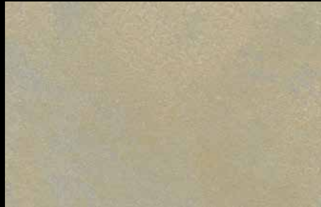
474 A + SILVER G 200