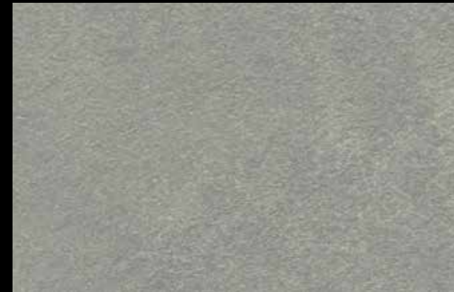
425 A + SILVER G 200