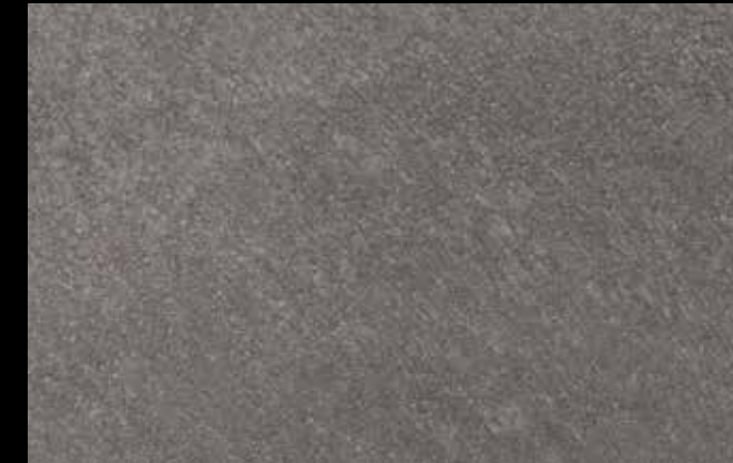
461 A + SILVER G 200