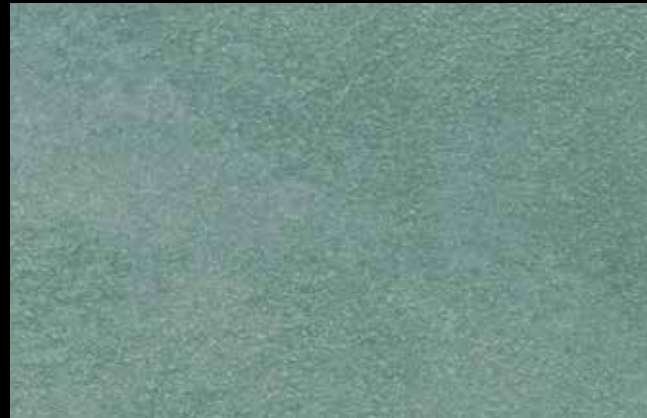
453 A + SILVER G 200