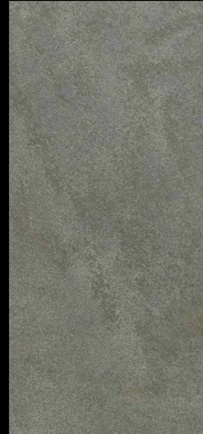
448 A + GOLD G 100 + STAR G 300