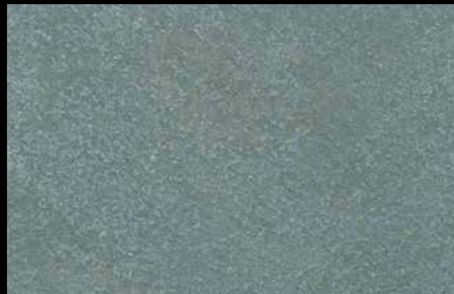
446 A + GOLD G 100