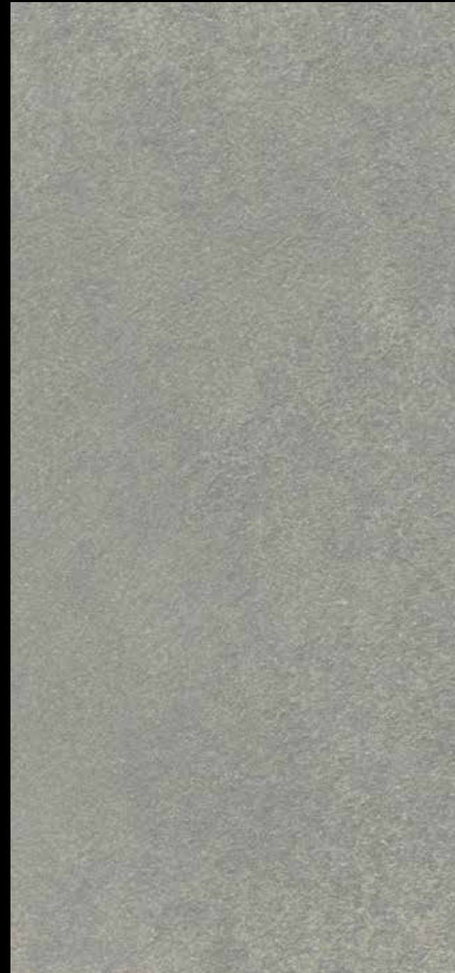
425 A + SILVER G 200 + STAR G 300