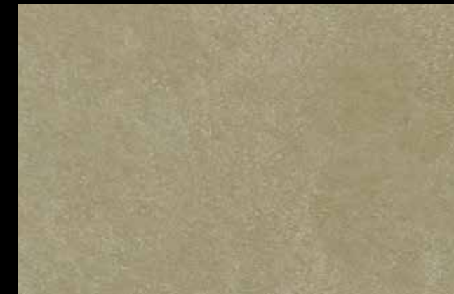
466 A + GOLD G 100