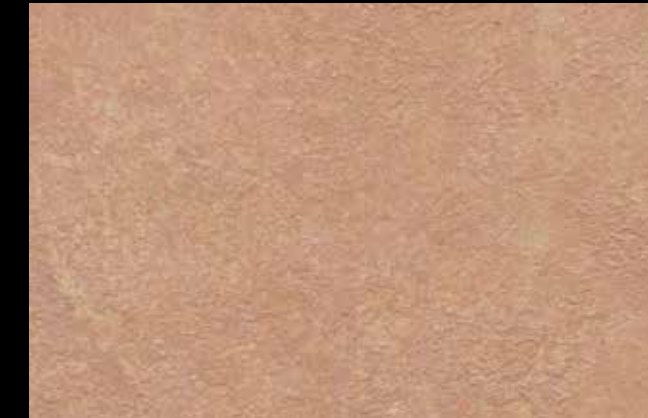
452 A + SILVER G 200