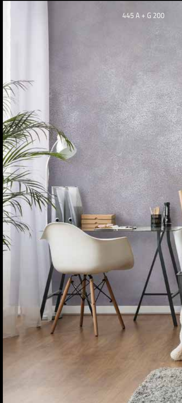
445 A + G 200