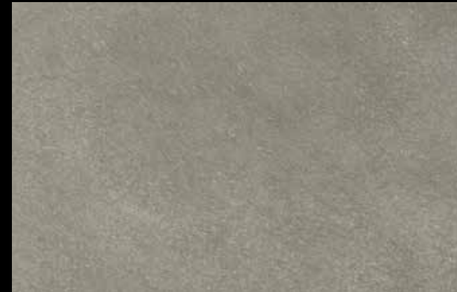
467 A + SILVER G 200