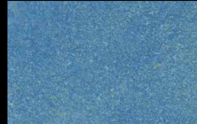
428 A + SILVER G 200