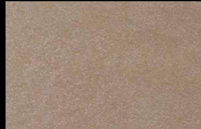
445 A + GOLD G 100