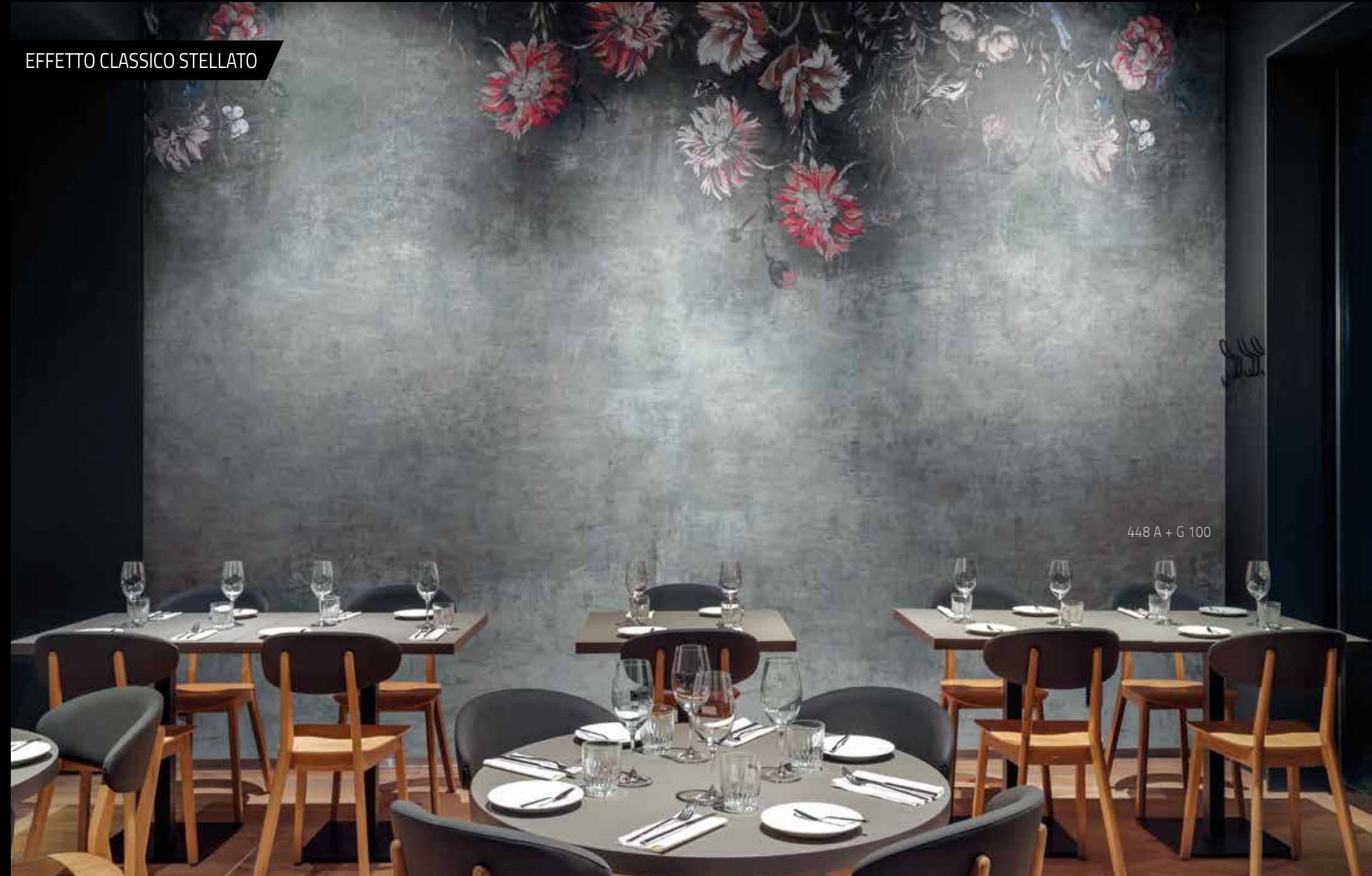
448 A + G 100