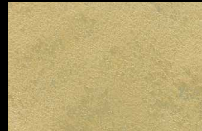
459 A + GOLD G 100