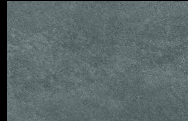
451 A + SILVER G 200