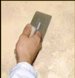
3) Klondike Light