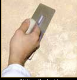
3) Klondike Light