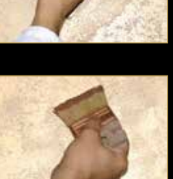
3) Klondike Light