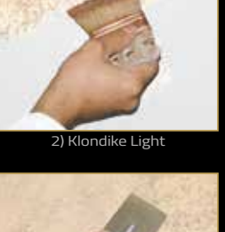
2) Klondike Light