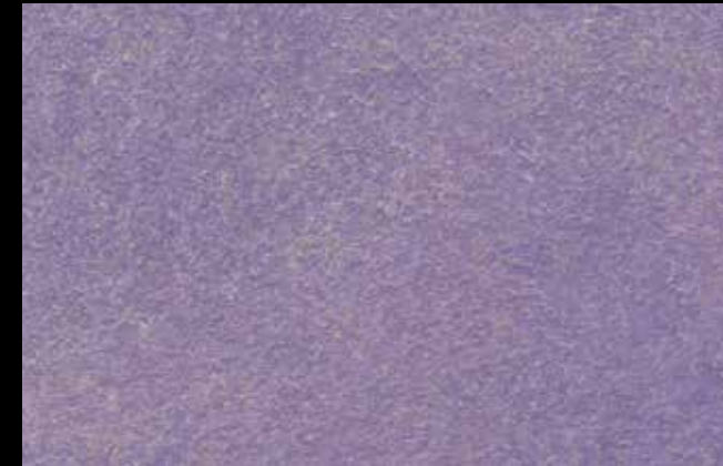
429 A + SILVER G 200