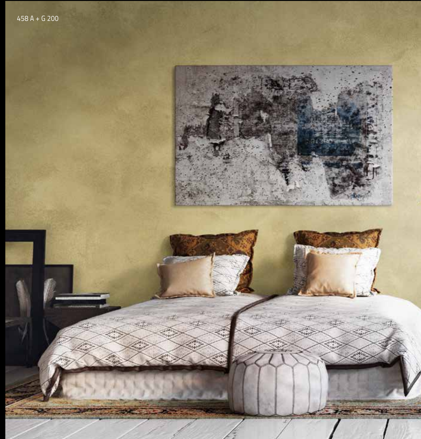
458 A + G 200