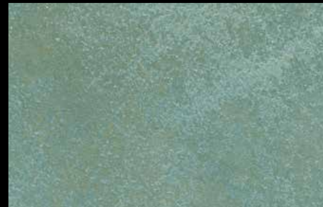
447 A + GOLD G 100