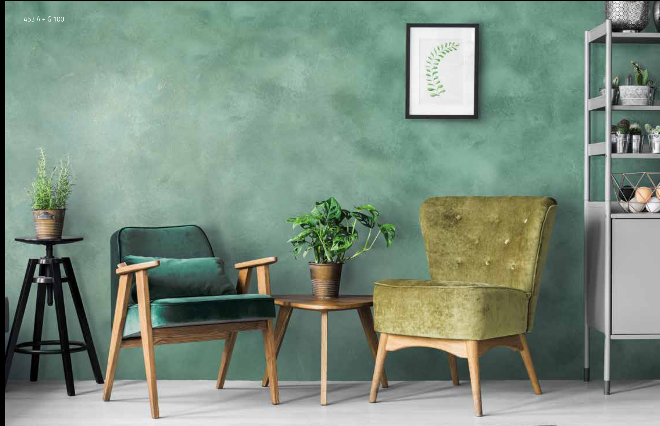
453 A + G 100