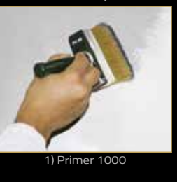
1) Primer 1000