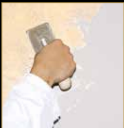
2) Klondike Light