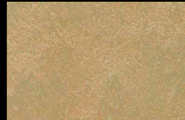
458 A + GOLD G 100