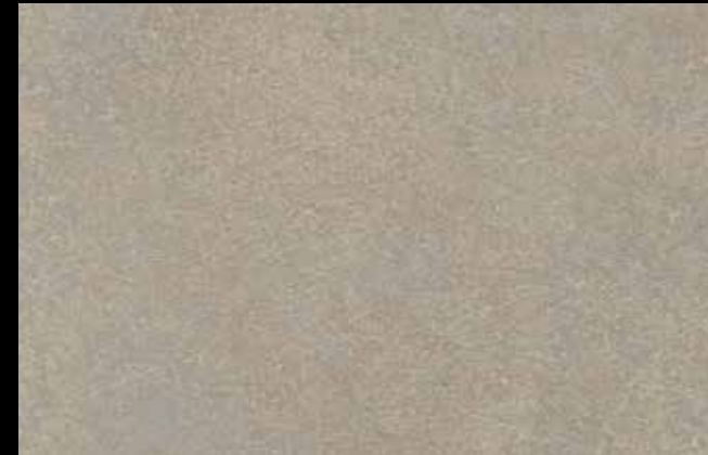
475 A + SILVER G 200