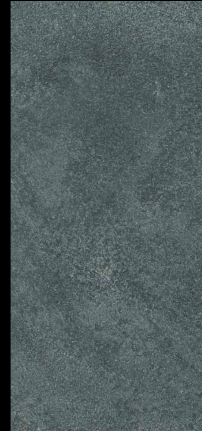
451 A + STAR G 300