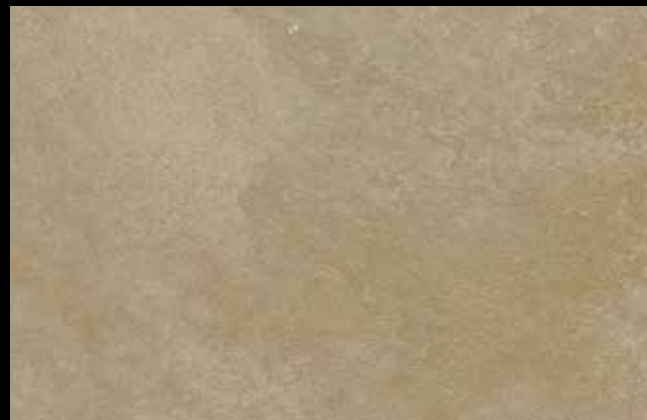
469 A + GOLD G 100