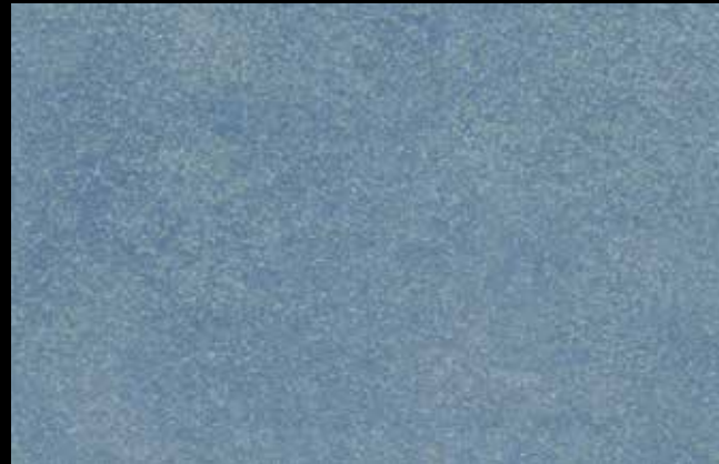
446 A + SILVER G 200