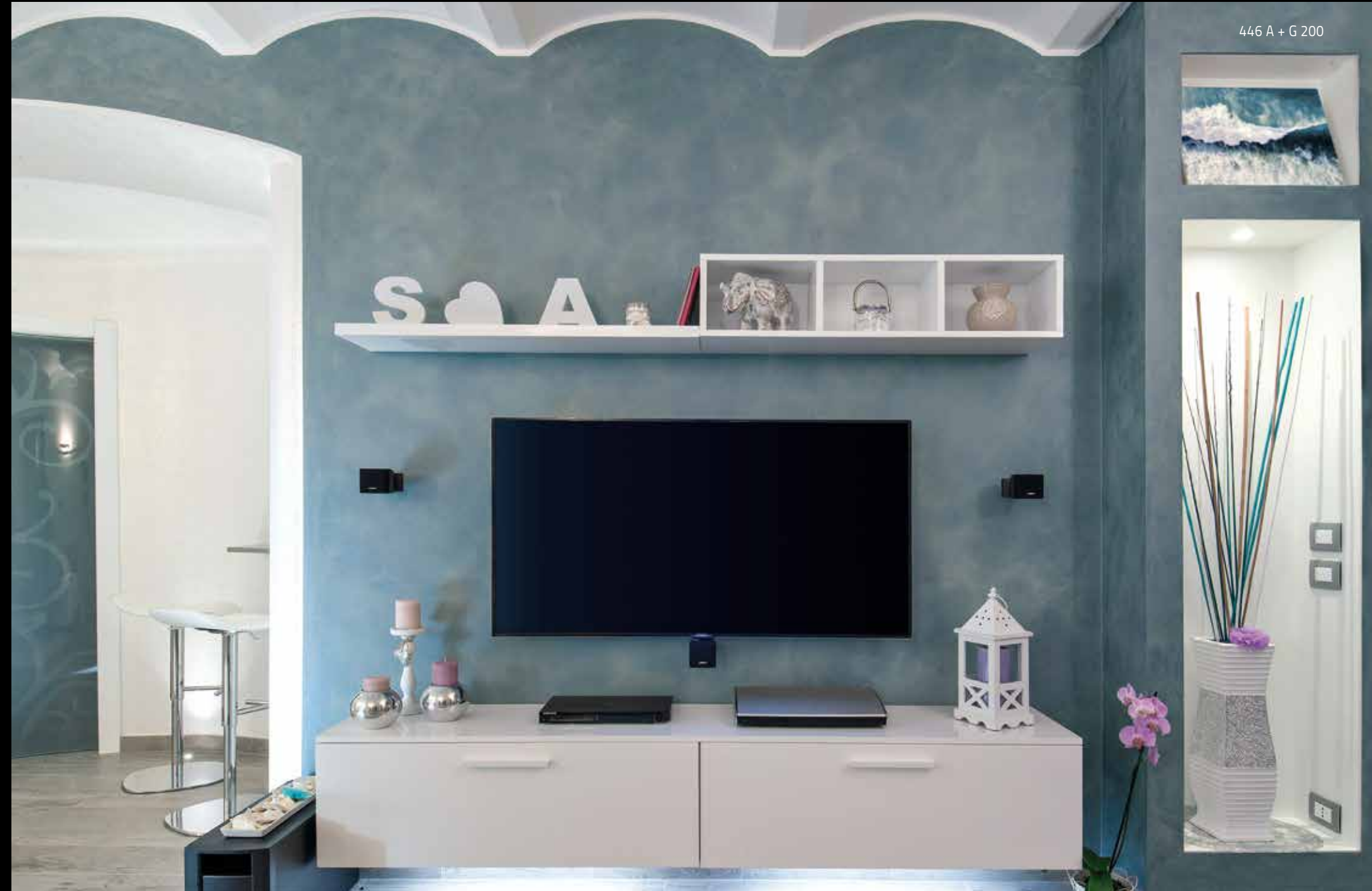
446 A + G 200