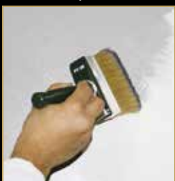
1) Primer 1000