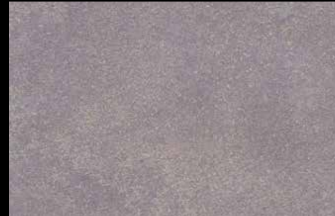
445 A + SILVER G 200