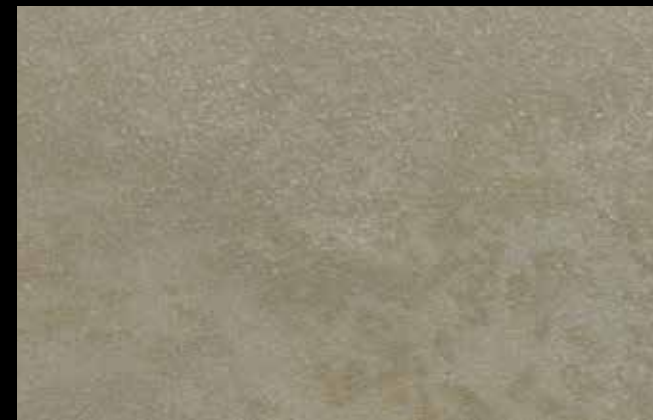
467 A + GOLD G 100