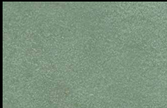
453 A + GOLD G 100