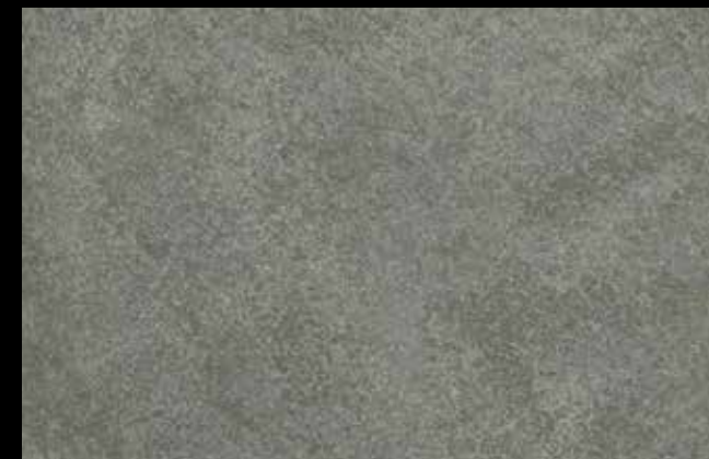
448 A + GOLD G 100