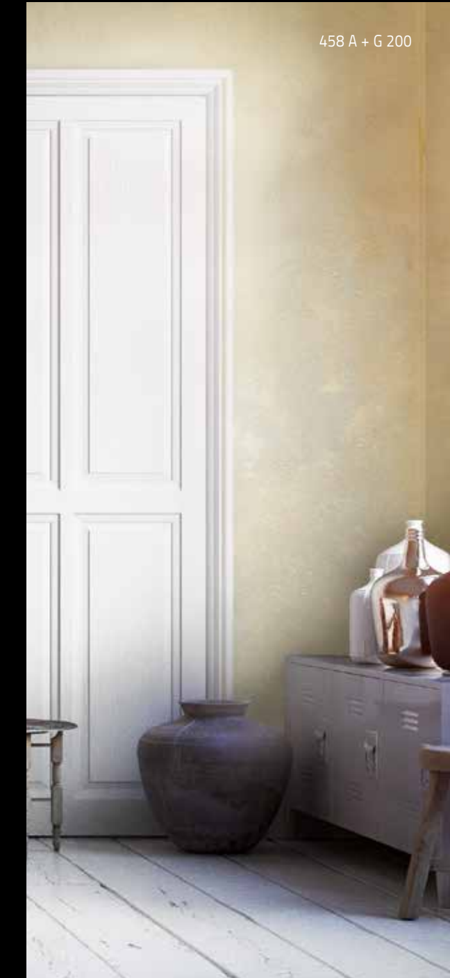
458 A + G 200