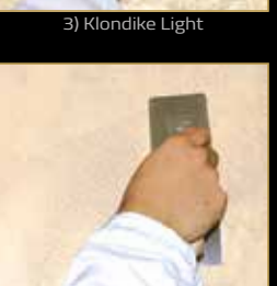
3) Klondike Light