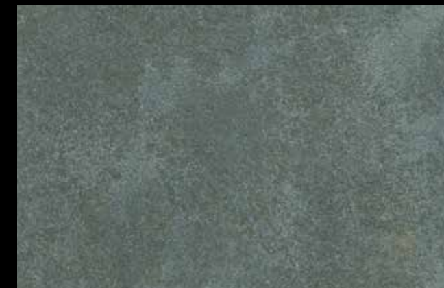
451 A + GOLD G 100