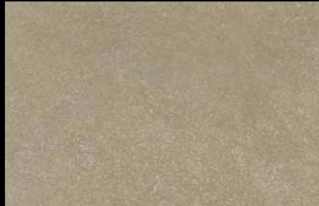
469 A + SILVER G 200