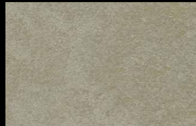
425 A + GOLD G 100