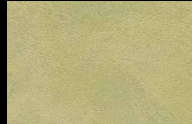
459 A + SILVER G 200