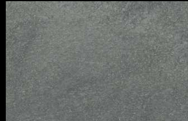
448 A + SILVER G 200