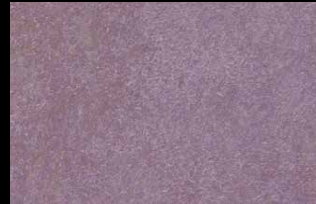
429 A + GOLD G 100