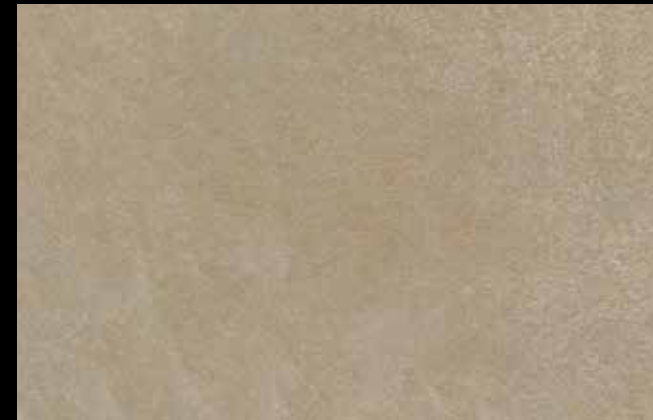
475 A + GOLD G 100