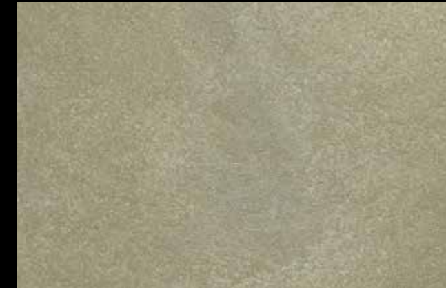
466 A + SILVER G 200