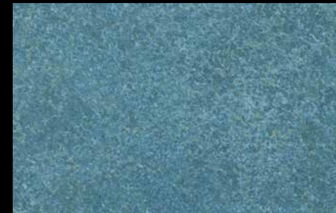
428 A + GOLD G 100