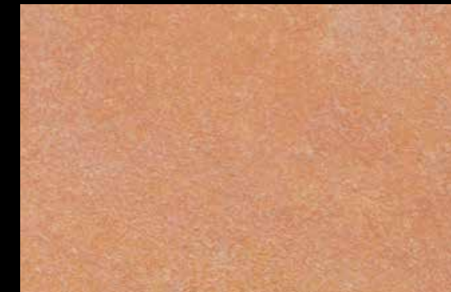
452 A + GOLD G 100