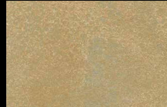
458 A + SILVER G 200