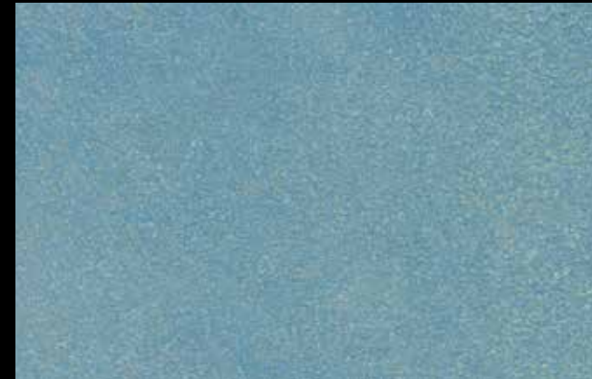
447 A + SILVER G 200