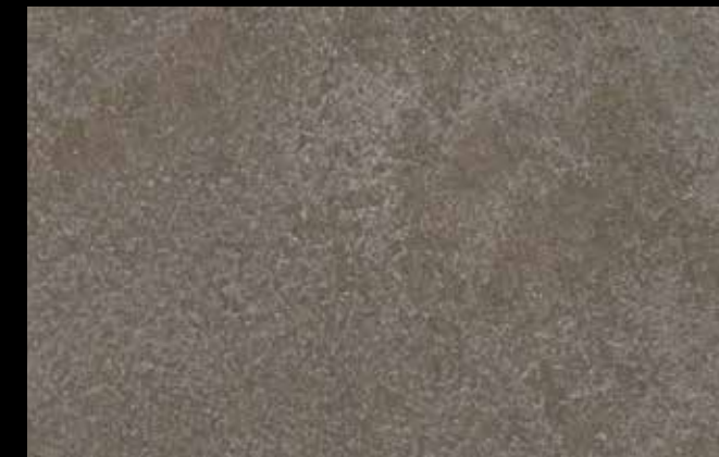
461 A + GOLD G 100