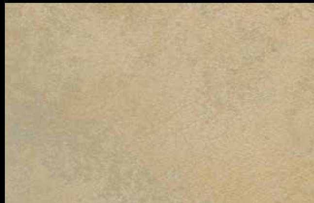
474 A + GOLD G 100